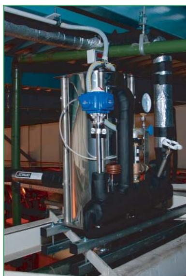
Фото 8. Криосепаратор газовой фазы

бопровода; ПК — предохранительный клапан для защиты трубопровода и сепаратора. Для автоматического поддержания уровня жидкого азота в пределах 10-50 % использован криогенный шаровой кран В2 компании «Halonit» с пневмоприводом «Компакт II». В качестве управляющего газа использована газовая фаза из верхней части сепаратора. Для повышения температуры газа он проходит через медный змеевик из трубки 6×1 мм. Управляющий электрический сигнал от датчика уровня преобразуется в пневмосигнал с помощью соленоидного клапана ЭПП компании «Samozzi» (Италия).