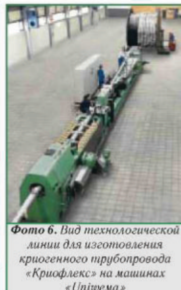
Фото 6. Вид технологической линии для изготовления криогенного трубопровода «Криофлекс» на машинах «Uniwema»

На фото 5 приведены концевые элементы трубопровода в двух исполнениях: присоединение стандартное неизолированное (слева) и с вакуумной изоляцией (справа).