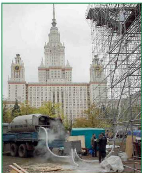
Фото 1. Слив жидкого азота из транспортной ёмкости (ЦТК-5/0,25) в генератор снега через гибкий металлорукав

табл. 1 приведены характеристики таких трубопроводов.