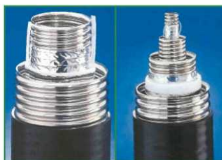
Фото 3. Трубопроводы «Криофлекс» для продуктов разделения воздуха и метана (а), а также гелия и водорода (б)

На фото 3 показаны устройства криогенных трубопроводов для транспортирования таких криогенных жидкостей, как кислород, азот, аргон и метан, а также жидкого гелия и водорода.