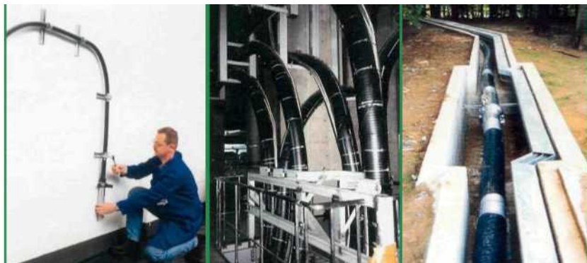
Фото 8. Варианты монтажа криогенных трубопроводов: а — настенное расположение; б — в лотках на эстакадах; в — в траншеях

ООО «Мониторинг» является официальным дистрибьютором компании Nexans.