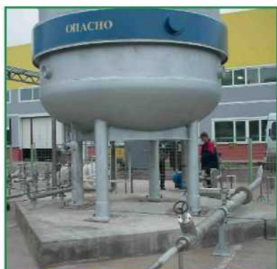
Фото 2. Криогенный трубопровод с экранно-вакуумной изоляцией в составе системы хранения