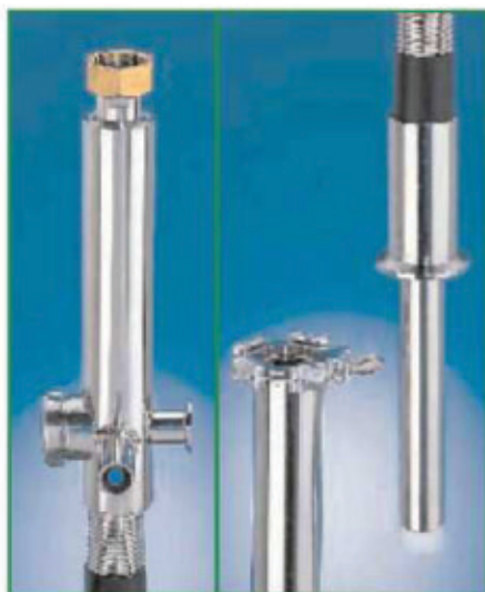
Фото 5. Концевые элементы криогенных трубопроводов: а — с неизолированным разъемом; б — с разъемом, снабженным вакуумной теплоизоляцией

На фото 5 приведены концевые элементы трубопровода в двух исполнениях: присоединение стандартное неизолированное (слева) и с вакуумной изоляцией (справа).